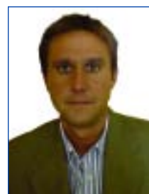
Por ANDRÉS GONZÁLEZ RAYO Socio Consultor AG & AG Bufete Laboralista, S.L Graduado Social núm. 4231